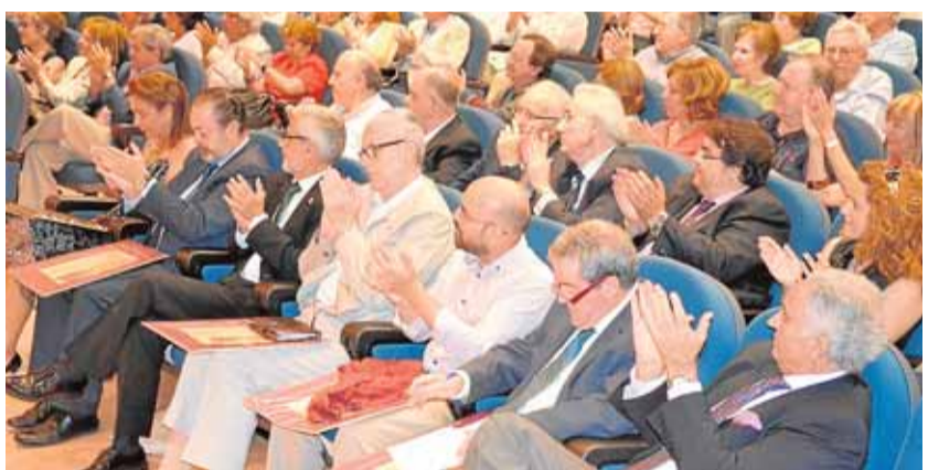
Unas 300 personas asistieron al acto en los salones de Unicaja.